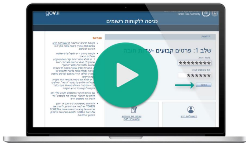
כהן ושות' - רואי חשבון

מצ"ב סרטון הסבר כיצד לבצע תיאום מס באינטרנט באתר רשות המסים: